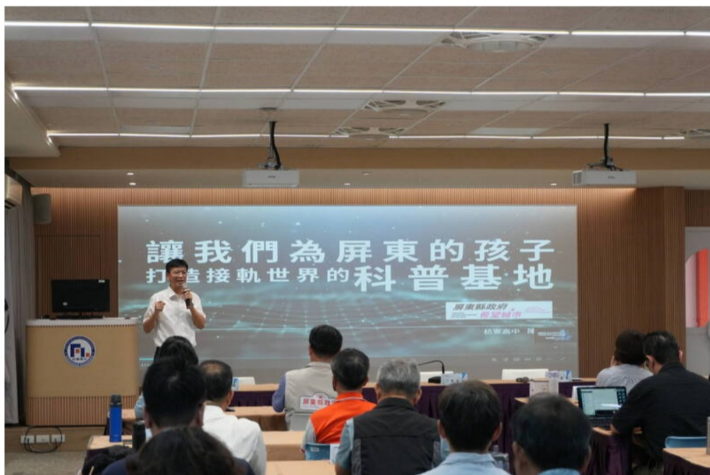
教育部長鄭英耀昨天訪視屏東枋寮高中，並和南屏東地區校長座談。

繼國家太空中心發射場域選定屏東縣滿州鄉後，屏東縣政府持續爭取相關教育資源投入，希望從學生時期開始紮根，縣長周春米陪同教育部長鄭英耀訪視屏東縣立枋寮高級中學，校長陳科名在座談時提出在校內設立「屏南科普基地」的計畫，盼為地方學子打造一條接軌世界的學習廊道。