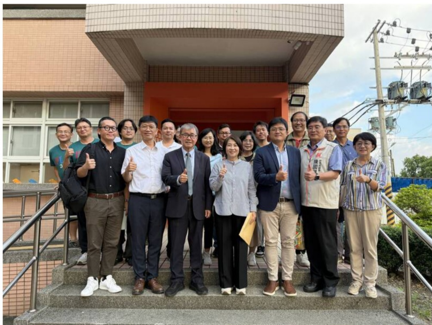
教育部長鄭英耀昨天訪視屏東枋寮高中，並和南屏東地區校長座談。

對於枋寮高中爭取建置科普基地提案；教育部部長鄭英耀給予正面回應，並允諾將全力協助解決師資、教師宿舍及校園設施修繕等問題。