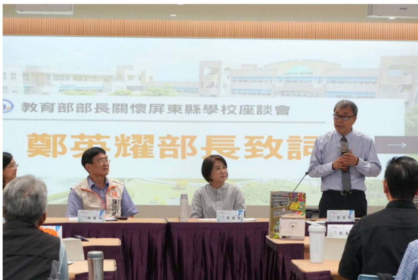
教育部長鄭英耀昨天訪視屏東枋寮高中，並和南屏東地區校長座談。