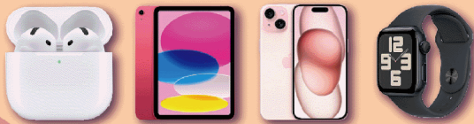
圖為示意圖，顏色、規格、配置等以實體為準