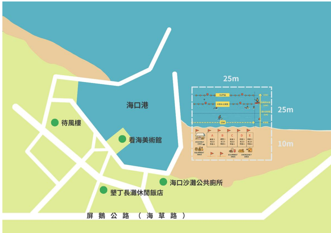
圖 1 海域安全推廣教育活動場域示意圖