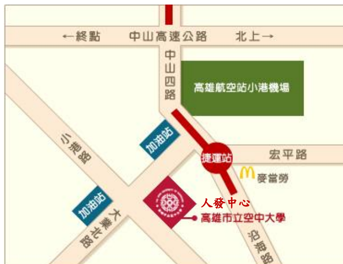
【高雄市立空中大學(公務人力發展中心)平面圖】