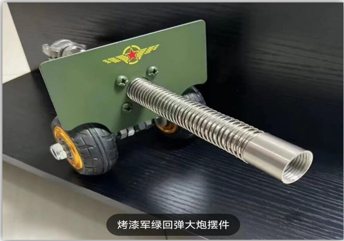
烤漆军绿回弹大炮摆件