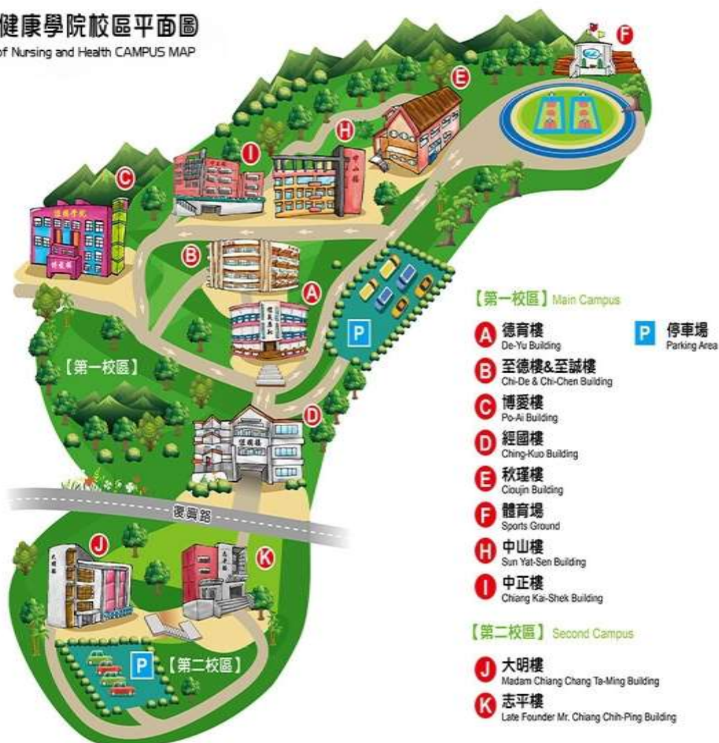
德育護理健康學院校區平面圖 Deh Yu College of Nursing and Health CAMPUS MAP