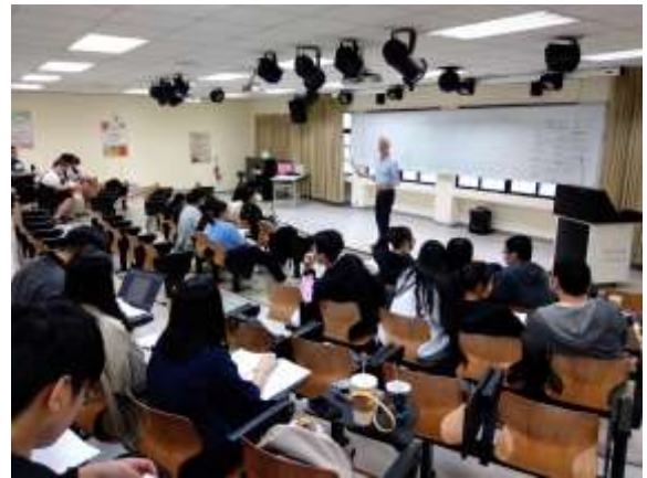
臨床情境模擬演練