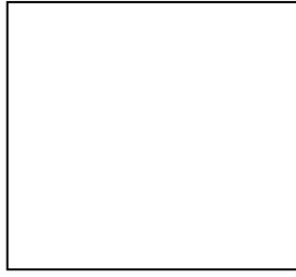
圖 1 XX 圖