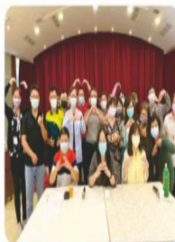
校外參訪-研討會合照