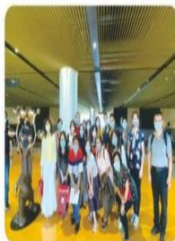
校外參訪-南市圖合照

以「培養具有社會關懷與法學觀之圖資人」為指導原則。本課程旨在提供圖書館從業人員法務相關所需之基礎知識，訓練法學邏輯思考的能力，期達致以融會貫通之智慧解決各種繁雜法律問題的目標。