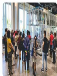
校外參訪-參觀自動借書機

掌握閱讀行為趨勢與轉變，熟悉閱讀推廣活動的規劃與設計，藉以創意推展各類型閱讀活動。