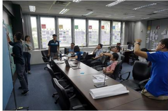
圖 6 檢視各區塊概念安排。

透過交叉分組，眾人重新檢視並確認各目標的概念，並且確定屬於社會、經濟、環境、核心價值哪個項目，並將概念寫在小卡上匯入概念圖庫，貼在三個大環中有交集的布牆上。