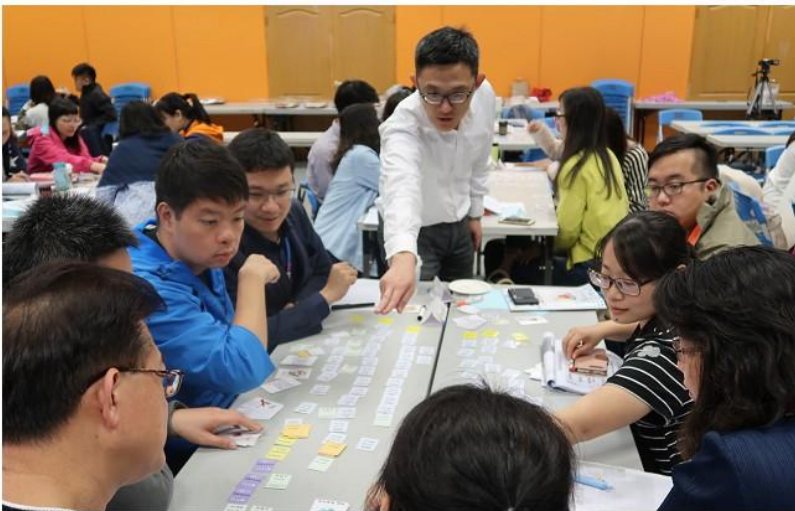
圖 3 龐大的卡牌資訊量，必須由協作講師共同指導。

運用小組式的分享，重新聚焦重點影響、具備的意義與需要什麼協助，過程中，水筆仔虛擬高中主任們，巡走於各分組，釋疑引導學員在操作上的不流暢感。由於區座間學員經歷不盡相同，學校間講講話的設計，可以讓學員發表自身至今的感想與經驗，各組觀察發表的交流，像是完備課程地圖、學生學習地圖、增加選課與生涯發展的關連性等，各校完成進度與執行方針的相互比對後，很明顯可以得見完全高中、綜合高中等的差異。