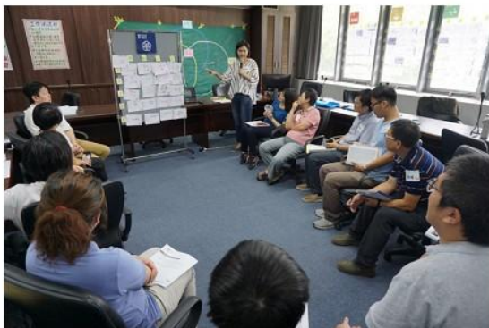
圖 4 凝聚全體共識。