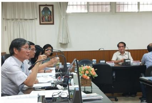
圖 2 明誠中學。

近一個月的時間，三組接連舉行區域會議，並配合辦理相關主題的教師研習活動，由台南組揭開序幕，提出素養導向教學、探究與實作課程研習需求，高雄組則是煩惱高雄市的學習歷程檔案系統尚未完工，增添學校端許多不確定性，也擔心自主學習學生的安全性及實行的實際情形會不會有所落差。雙東組提出行政端的工作負擔增加，空間及人力不足的問題。透過此次會議可以讓各校從問題中學習，也可以根據委員的建議慢慢修正執行的方向。