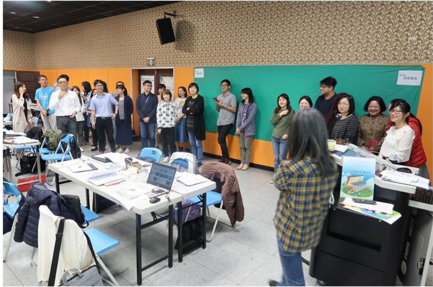
圖 4 四角辯論站位移動。