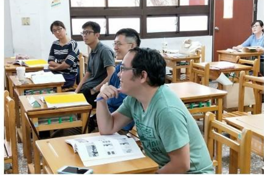
圖 5 與會教師們非常投入得聆聽著。