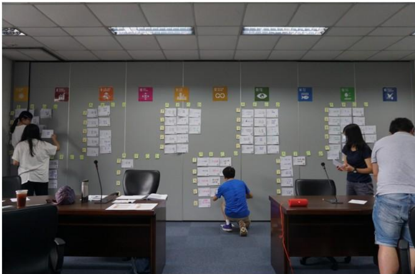
圖1 師長們閱讀聯合國SDGs17項可持續發展目標，進行概念撰寫。

邀請與會教授與各領域高中教師閱讀「聯合國SDGs17項可持續發展目標」中的教育學習目標文件，依照自己「學科專業」出發，每項目標各撰寫五概念，並勾選這個概念可以放在社會、經濟、環境、核心價值哪個項目之下。完成概念撰寫則黏貼在各目標之下。