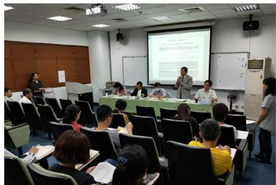
圖 3 瀛海中學。

因各校差異因素，無法符應學校真正需求，因此有巡迴輔導的制度針對學校真正的需求做出必要的協助，也在課綱推動當中提出需要解決的問題以及各科別所需的外部需求，甚至是行政端的協助，讓學校在新課綱上路時能夠走得更順利。