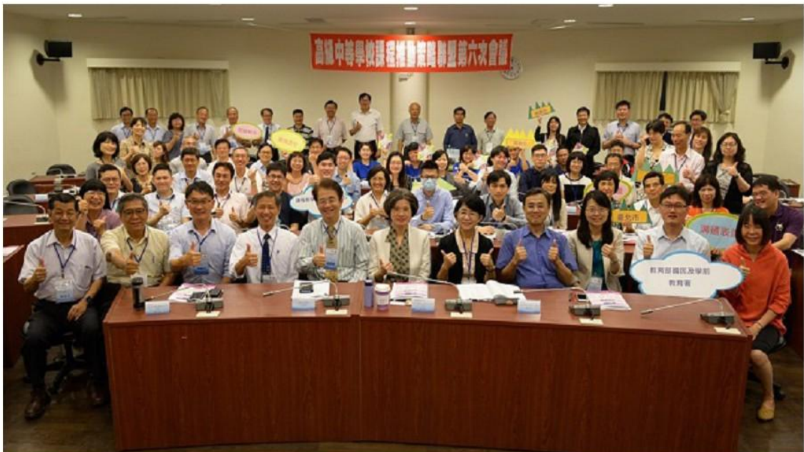
圖 3 六都策略聯盟第六次會議。

二、促成國教署與各高級中等學校主管機關策略聯盟的成立，建立高級中等學校課綱推動、課程發展、教學輔導及相關配套的跨域橫向交流平台，進一步強化高中職優質化方案、前導學校計畫、課推工作圈及學（群）科中心與地方政府的連結與合作，強化專業支持系統。