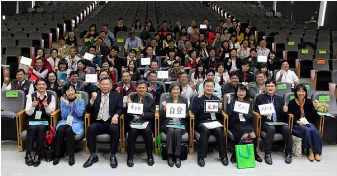
圖 1 六都策略聯盟。

《十二年國民基本教育課程發展建議書》指出，課程改革常無法克竟其功，原因之一在缺乏足夠課程領導人才及完善課程領導機制。過去各教育階段課程治理係依教育部行政組織劃分，相關事務分散不同單位，彼此連結與整合不易。由於涉及層面繁雜，從課程研發、師資培用、課程教學實施與推動、學生評量、入學考試、課程評鑑與回饋等，每個環節均須環環相扣，因此建議教育部設立一個超越司署，由教育部長或次長直接領導的整合平臺與協作機制（國家教育研究院，民 102）。