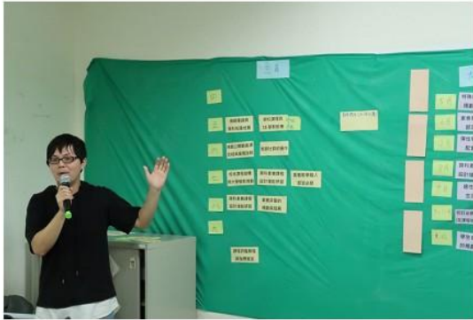
圖 7 三義高中甘特圖分享。

完成分享與甘特圖排列後，可以看出五校目前的進展與需求不盡相同，也讓五校得知區域學校在新課綱推動進度的關聯落差點，而資源是否共享互通的可能性，也在彼此交流間展開；簡菲莉前處長接著請在場學校依普高及綜高分組對話討論，並建議每一所學校提出在 9 月開學前，希望高優團隊可以給予的支持三件事，待討論過後進行綜合座談。