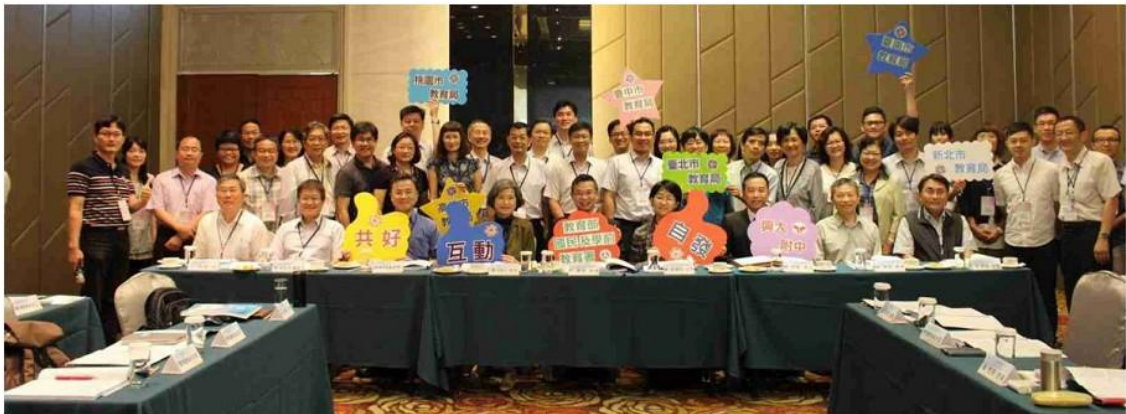
圖 2 六都策略聯盟。