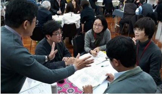
圖 4 教育部素養導向教學及評量培力共識營