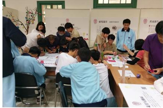
圖 6 安平壺展極受歡迎的摺紙互動區。