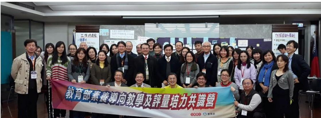
圖 5 六都策略聯盟。

協作中心 107 年 10 月底完成階段性任務，教育部隨即成立十二年國教新課綱推動專辦公室接續相關工作。「好，還要更好。」對課程與教學精進的追求，需長期、持續不斷努力。這些年經由各單位的齊心努力，高級中等學校課程與教學專業支持系統已經略具規模。然而，在中央課程研發系統（國家教育研究院）、課程推動系統（國民及學前教育署）、師資培育系統（教育部師資培育及藝術教育司）的橫向整合，以及中央與各直轄市政府教育局、各縣市政府不同權責單位的縱向整合，如何繼續努力精進，仍然是未來國家課程治理的重要課題，值得各界持續關注與重視。