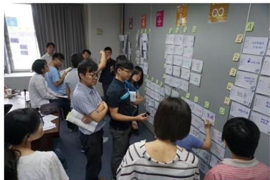
圖 5 分組討論各目標概念。