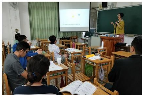
圖 6 大同高中教師分享校內建立教師閱讀理解社群的過程。

南區各個學校從無到有的這段艱辛歷程夥伴們都看在眼里，從一開始圈內會議，到後來圈與圈聯合同心協力，到現在南區每圈之間緊密相連，透過一次次的會議，讓彼此成長茁壯。新課綱執行的路才正要開始，相信有夥伴間的扶持，在新舊課綱的陣痛期，南區一定能走得更加穩健。