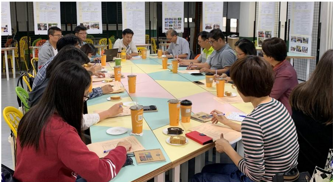
圖 1 教務工作社群每月定期會議。

為能確實發揮即時且互相交流分享的功能，強化彼此的聯結及訊息的傳遞，三所學校決議以時下流行之社群軟體成立即時之溝通平台，組成了「緜星群耀 107 前導」LINE 群組，邀請屏東區及台東女中各校教務主任及承辦業務之組長加入此一群組，一起為新課綱的推動而努力。底下分別針對 LINE 群組織「功能與目的」、「經營與現況」及「未來可強化之處」三大部分說明。