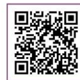
教育部紀錄影片分享