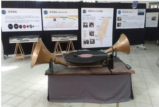
圖 7 黑膠展大膠裝置藝術。