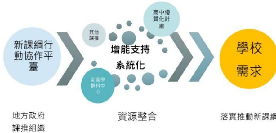
圖 1 新北市政府建置新課綱行動平臺服務功能示意圖。

隨著 108 新課綱的到來，如何在十二年國民基本教育課程的整體架構下，讓高中學校成為實踐素養學習場域，培養學生成為未來多元創新的人才，是落實新課綱的一大考驗。特別是地方政府要怎樣帶領學校教育邁入新的階段，在課程與教學上，給