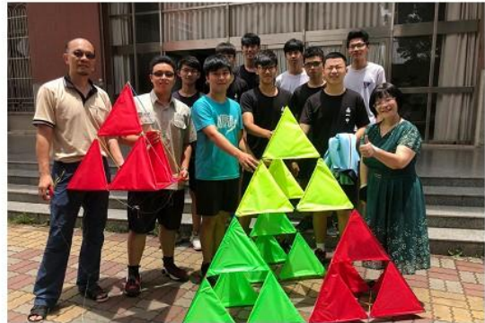
圖 8 參訪南美館從碎形屋頂開發碎形風箏。