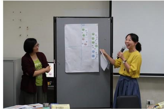
圖 4 興華高中象限分析解說。