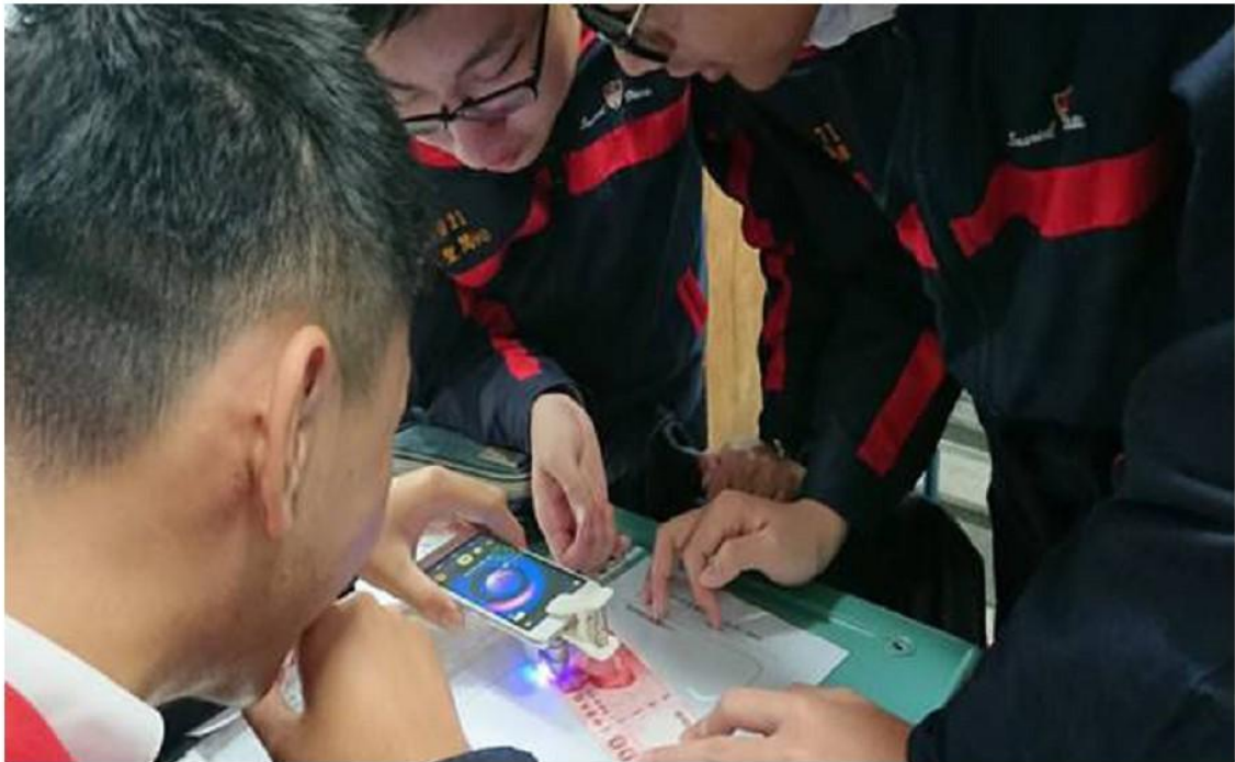
圖 2 閱讀完科普文本後，利用手機顯微鏡探索週遭事物，引導學生設計專題實驗。

具有素養能力的教師，方能設計出素養導向課程；持續精進努力不懈的教師；方能在教學中引導學生終身學習。在課程的準備及教師的增能研習中，也因獲得優質化經費的挹注與全中教的社群輔導，讓我們在閱讀策略、素養課程設計、小論文寫作等做增能研習，使教師專業知能達到一致性。108課綱翻轉的第一步是教師的軟實力，正心高中的教師們將以全新的思維翻轉課堂的教與學，走在前端，全力以赴迎戰新課綱。