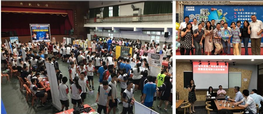
圖 1 雲林博覽會。 圖 2 嘉義場課程博覽會。 圖 3 雲嘉圈聯合諮詢。