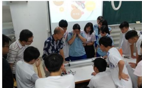
圖 2 酒家菜與那卡西。