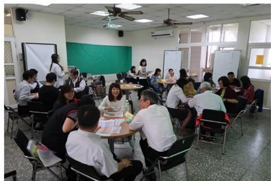
圖 2 輔導座談各校分組討論。