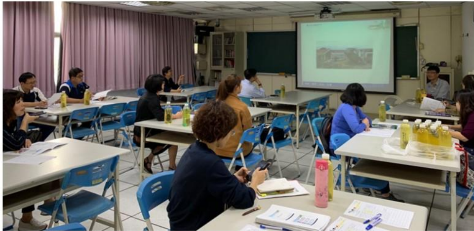
圖 2 課發會組織運作分享。