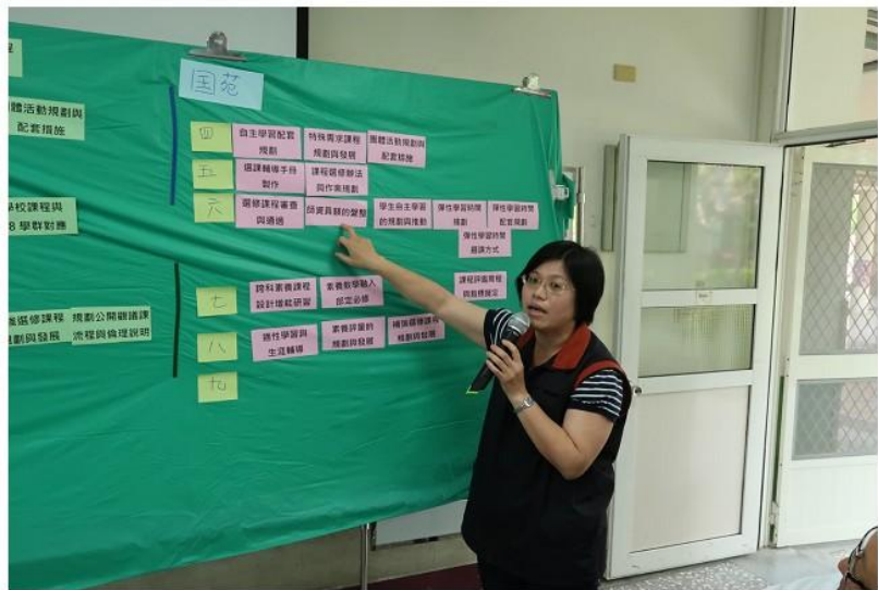
圖 6 國立苑中甘特圖分享。

三義高中： 為因應大學端而規劃的學程，因創校規劃多元，不同學制上對學生的要求與期待不同，導致學程規劃上多項問題產生。單一處室推動缺少資源配套，校內無資深行政教師且外部支援短缺，新課綱規劃的驗證與調整無法獲得立即反饋。