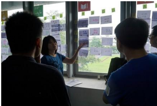
圖 2 交叉檢視、調整各目標的概念。

接著，便以單雙組方式開始分組工作。歷經三個小時的討論，眾人從 17 個目標產出約 80 個重要概念。