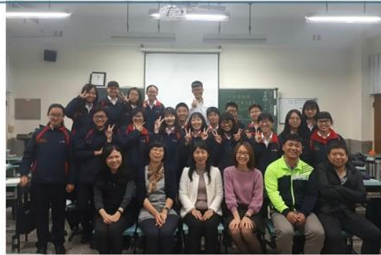
圖 1 表現任務發表後，與校長大合影。

向發想、後設認知、素養導向教學，將上、下學期 36 週課程切割成「媒體識讀」、「女權」、「文明的演變」三大主題，確認核心概念，並使用 Rubric 互評表、工作日誌、ORID 學習單、閱讀心得與小論文實作、閱讀素養混合試題等多元評量方式，免