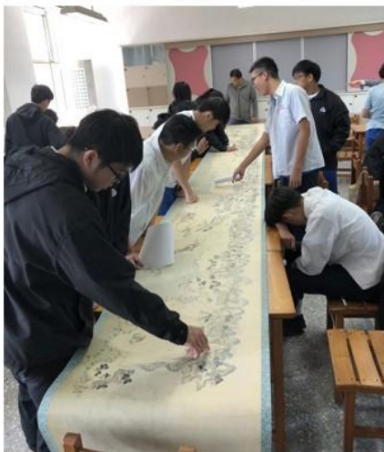
圖 1 北投古地圖探究。

105 學年上學期期末課程發展委員會提案討論，由校長親自說明每一主軸課程開設 18 周，分為 3 個主題，均協同教學實施。每一主軸至少需由 6 學科聯合開發課程內容，且以教師跑班學生不跑班的方式進行授課，每三個班為一群。高一普通班 18 個班採上下學期對開方式開課，每個班級同學在上下學期均會上到校訂必修之兩大主軸課程。