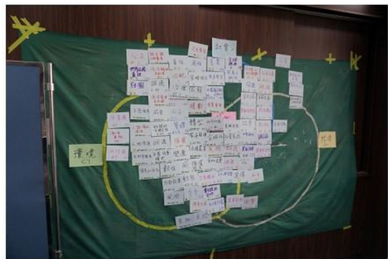
圖 3 概念卡片匯入圖庫布牆。