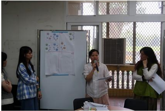
圖 5 大同高中象限分析解說。