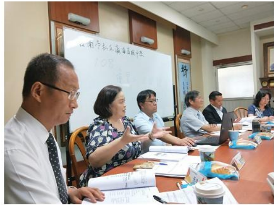
圖 1 北門高中。