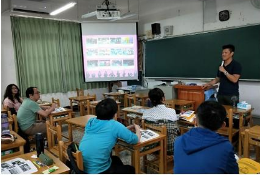
圖 4 美和高中教師精彩的國際議題 TED 導讀。