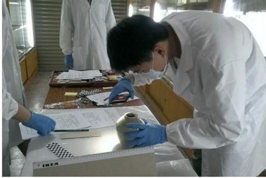
圖 5 文物安平壺清潔測記拍照登錄。